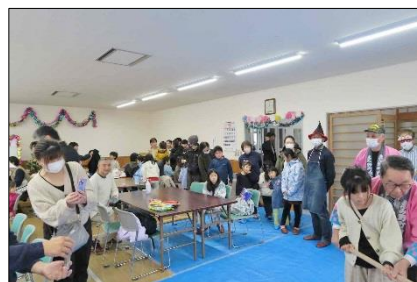
おかあさんも応援します

もちつき体験は、10時半、11時半、12時半。いままでそれぞれ2回の計6回のもちつき体験でしたが、今年はたくさんの申込にもち米量を増やし、餅つき器のトラブルも重なり、計9回日でもちつきをしました。時間帯の参加人数もほぼ同じ、もちつきも会場利用もほぼフル回転し、体験希望者全員に応じることが出来ました。集会室、和室に並べられたテーブルには、仲良しグループや家族連れで占められ、お好みでお汁粉、きなこ餅、大根おろし餅を囲んで団らんする様子が見られました。例年と同じ開催時間で増えたもち米に対応した役員には、稼働密度の濃いイベントとなりました。