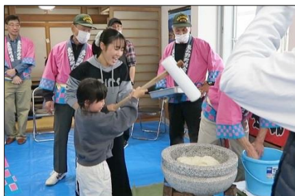
お姉ちゃんと一緒に、お父さんは記念写真

もちつき体験は、10時半、11時半、12時半。いままでそれぞれ2回の計6回のもちつき体験でしたが、今年はたくさんの申込にもち米量を増やし、餅つき器のトラブルも重なり、計9回日でもちつきをしました。時間帯の参加人数もほぼ同じ、もちつきも会場利用もほぼフル回転し、体験希望者全員に応じることが出来ました。集会室、和室に並べられたテーブルには、仲良しグループや家族連れで占められ、お好みでお汁粉、きなこ餅、大根おろし餅を囲んで団らんする様子が見られました。例年と同じ開催時間で増えたもち米に対応した役員には、稼働密度の濃いイベントとなりました。