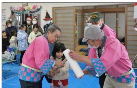
しっかりもちをつこうね