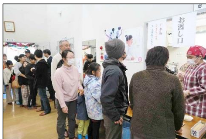
何を食べようか迷います。おかわり自由。