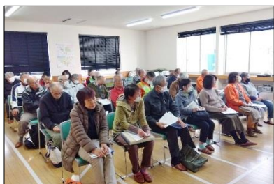
研修に参加した隊員のみなさん