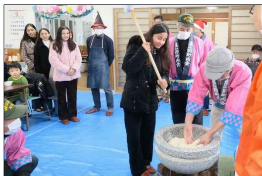
餅の中心を見つめて・・・、大丈夫かな？

今年は北町内会創立40周年、もう少しバージョンアップを検討します。お楽しみに!!