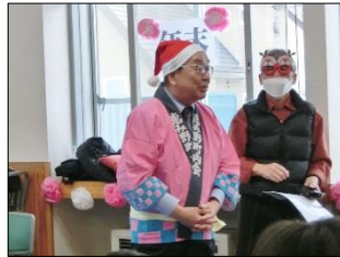
恵庭市長のごあいさつ