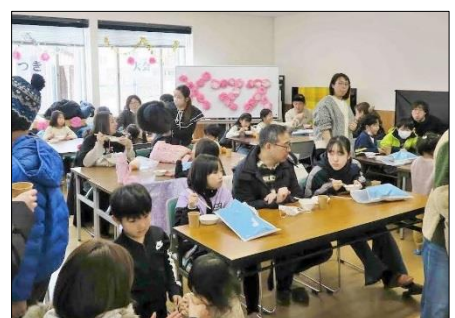
みなさん、美味しそう！楽しそう！