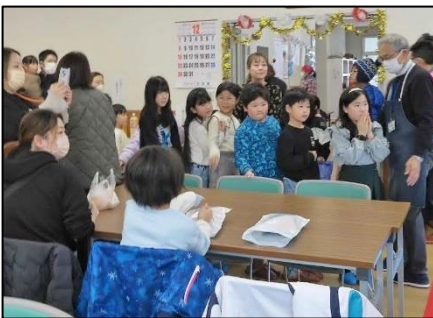
早く“もちつき”出来ないかなー

今年は、申込数に対して参加人数が減少しました。参加出来ず、家にいる子供用にもちをもらえませんかという相談がありました。お持ち帰り頂きましたが、来年はみんな揃って、子供優先、会場全体でもちつきを楽しむ年の瀬大イベントを目指し取り組みたいと思います。