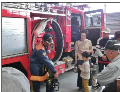
消火時着用装備の説明