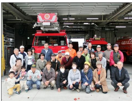
岩見沢消防署前にて記念撮影