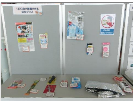
100均で準備できる防災グッズ