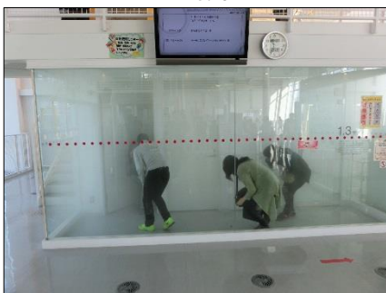
煙避難体験コーナー