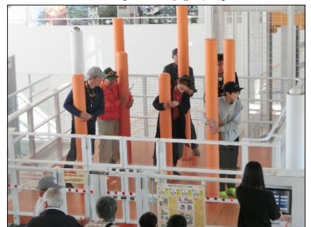
地震体験コーナー