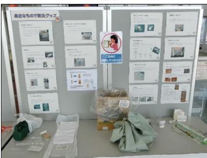
身近な物で防災グッズを！