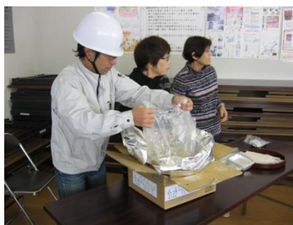
アルファ米の調理について