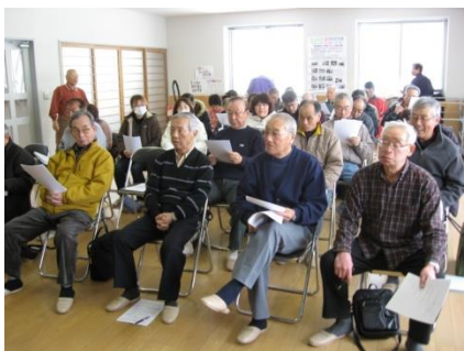
今後の研修計画について

2月17日(日) 13:00~15:00 北会館にて、平成25年度第1回研修会が実施されました。