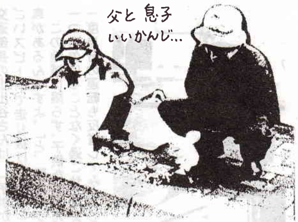
父と息子 いいかんじ...