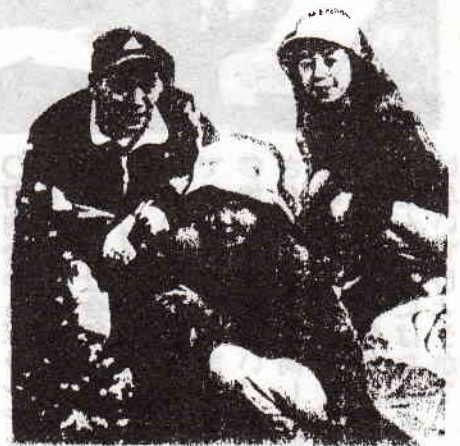
春に引越ししてきました

…1時間程で、道はきれいになり 自分の心も、少し軽くなった気が した「日曜の朝」だった。