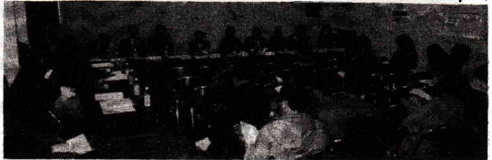
1年間の報告、来年の見通しなど話し合いました。お疲れさまでした。

時代に合わせ「女性部」とします。 ☆ その他の意見として、現在区長がしている集金を班長の仕事にしてはどうかという提案がありました。それについて総務部長から「町内会活動をするにあたっては、役員と区長に対しては保険を掛けているが、それを班長にまで広げることが難しいのでしません。」との回答がありました。